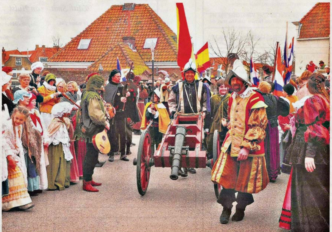
De Slag bij Brielle belooft een groot spektakel te worden in Almelo.